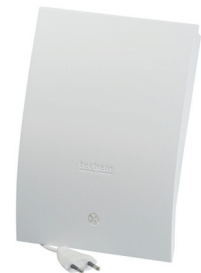
Recopilador de datos maestro