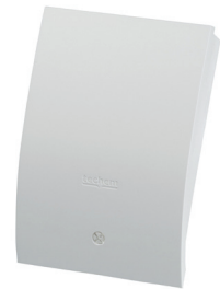
Recopilador de datos

El recopilador de datos maestro guarda todos los valores de consumo y las informaciones de aparato de toda su red de radio, que se compone de los repartidores de coste y de los recopiladores de datos. Se pueden gestionar hasta 2000 aparatos de radiolectura en una red de radio con hasta 60 recopiladores de datos. Como memoria de datos no volátil y segura contra el fallo de red, el recopilador guarda los datos de consumo de cada repartidor de costes. Además el recopilador de datos maestro se encarga de la comunicación con el centro de cálculo de Techem. Dicha comunicación se realiza por medio de un módem GPRS integrado que establece una conexión IP-VPN segura.